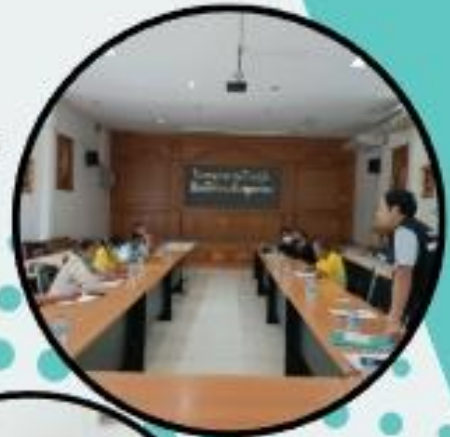
การประชุมวางแผนกิจกรรมรณรงค์วัคซีนโควิด-19